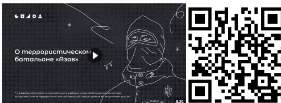
Рисунок 2 – Видеоролик, разъясняющий причины признания организации террористической

3) батальон «Азов» (см. рисунок 2) — военизированное подразделение, созданное в 2014 году на базе футбольных ультрас и праворадикалов Харькова и некоторых других украинских регионов. «Азовцы» причастны к массовым военным преступлениям против мирного населения Донбасса и Украины. Сама организация признана террористической в России по решению Верховного Суда Российской Федерации от 02.08.2022 г. № АКПИ22-411С. Батальон «Азов» входит в состав Национальной гвардии, подчиненной Министерству внутренних дел Украины. С 2014 года боевики батальона «Азов» систематически пытали, убивали и грабили мирных жителей ДНР, ЛНР и востока Украины. У батальона неонацистская идеология. Это проявляется в расизме, русофобии, восхвалении наследия Третьего рейха и украинских коллаборационистов в годы Второй мировой войны. Среди боевиков в том числе распространены радикальные неоязыческие взгляды. Свою идеологию боевики активно распространяют среди украинской молодежи через лагеря подготовки, печатную продукцию (комиксы, книги) и интернет-сообщества. С «Азовом» активно сотрудничает большое количество праворадикальных течений на Украине (признанных в России экстремистскими организациями), например, «Правый сектор», «УНА-УНСО», организация «Тризуб им. Степана Бандеры» и т.д.