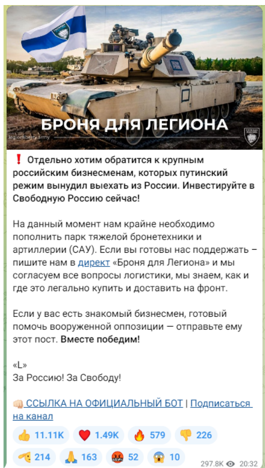
Рисунок 3 — Скриншот телеграм-канала легиона «Свобода России» с призывом к финансированию

Важно подчеркнуть, что помимо собственно пропаганды и распространения идеологии террористических организаций, а также вовлечения в деятельность террористических организаций существует еще одна угроза террористического характера — ложные сообщения о готовящемся террористическом акте. Только за 2021 год зафиксировано более 4,5 тысяч ложных сообщений о готовящихся терактах на объектах социальной инфраструктуры. Это может быть хулиганство, злой умысел, специфическое чувство юмора, желание проверить качество работы правоохранительных органов или антитеррористическую защищенность объекта и др. Во всех вышеперечисленных случаях за такой поступок придется нести уголовную ответственность. Ведь злоумышленник нарушает конструктивную деятельность общественных объектов, а правоохранителям приходится задействовать множество средств и сил, чтобы проверить объекты, которые якобы находятся под угрозой. За ложное сообщение о готовящемся теракте правонарушитель может быть наказан либо штрафами – от 200 тысяч рублей и до двух миллионов рублей, либо лишением свободы – от одного года до 10 лет. Ответственность за данный вид правонарушения наступает с 14 лет (статья 207 УК РФ «Заведомо ложное сообщение о акте терроризма»).