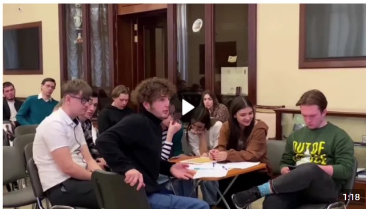
Дебаты «Идеология радикальных организаций» 1 888 просмотров

В рамках дебатов можно: развенчивать мифы, декларируемые представителями радикальных идеологий для вербовки; развивать навыки критического мышления и ведения дискуссии; формировать в целом антитеррористическое сознание и активную гражданскую позицию. Рекомендуется для мероприятия вовлекать не более 20 человек (см. рисунок 5).